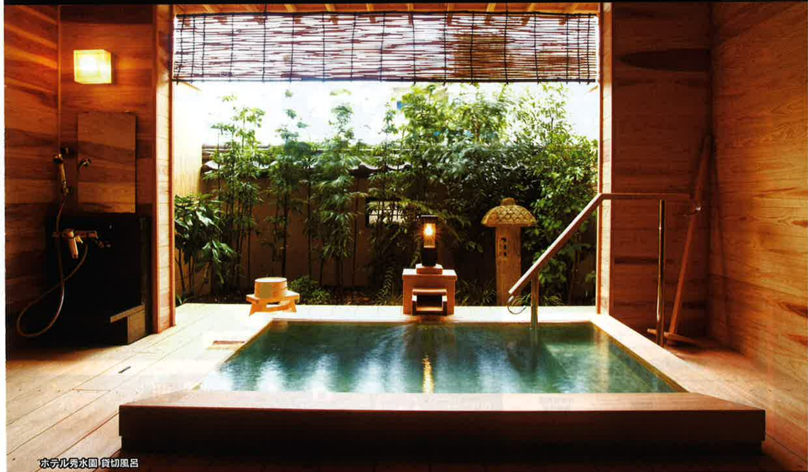
ホテル秀水園 貸切風呂