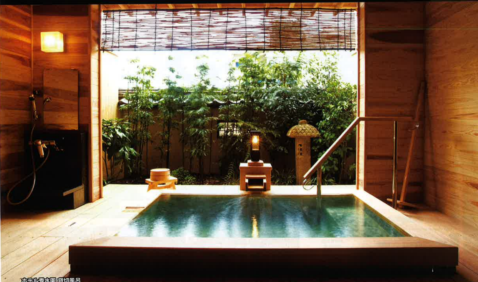
ホテル秀水園 貸切風呂